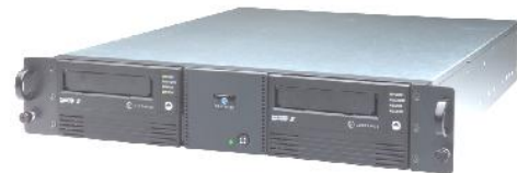
LTO2 Dual カートリッジ

お問い合わせ先: 株式会社ワークマンシップ / WORKMANSHIP Co., Ltd. http://www.workmanship.com