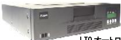
LTO オートローダー AL810