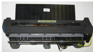
SPARCPrinter E の Fuser