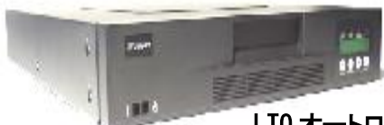
LTO オートローダー AL810