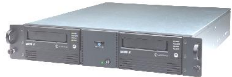
LTO2 Dual カートリッジ

お問い合わせ先: 株式会社ワークマンシップ https://www.workmanship.com